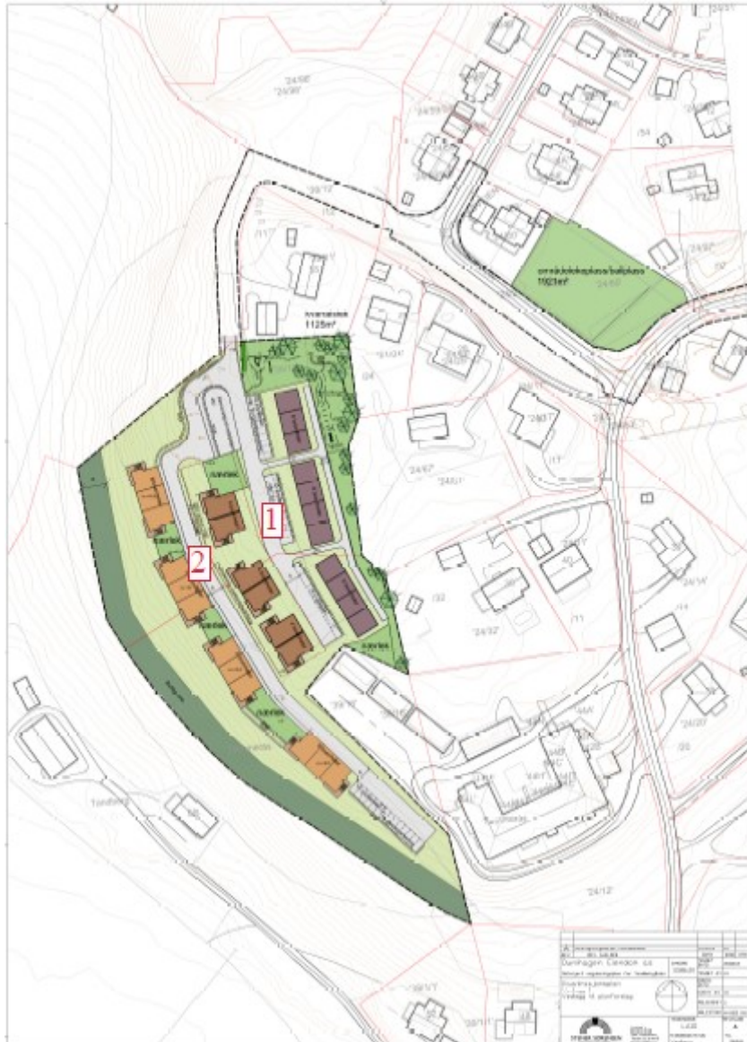
Figur 2: Nye veier på Tandbergåsen sydvest.