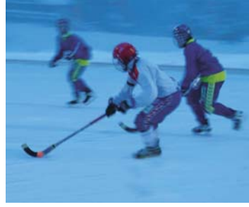
Bandylandskamp på Klevjerhagen