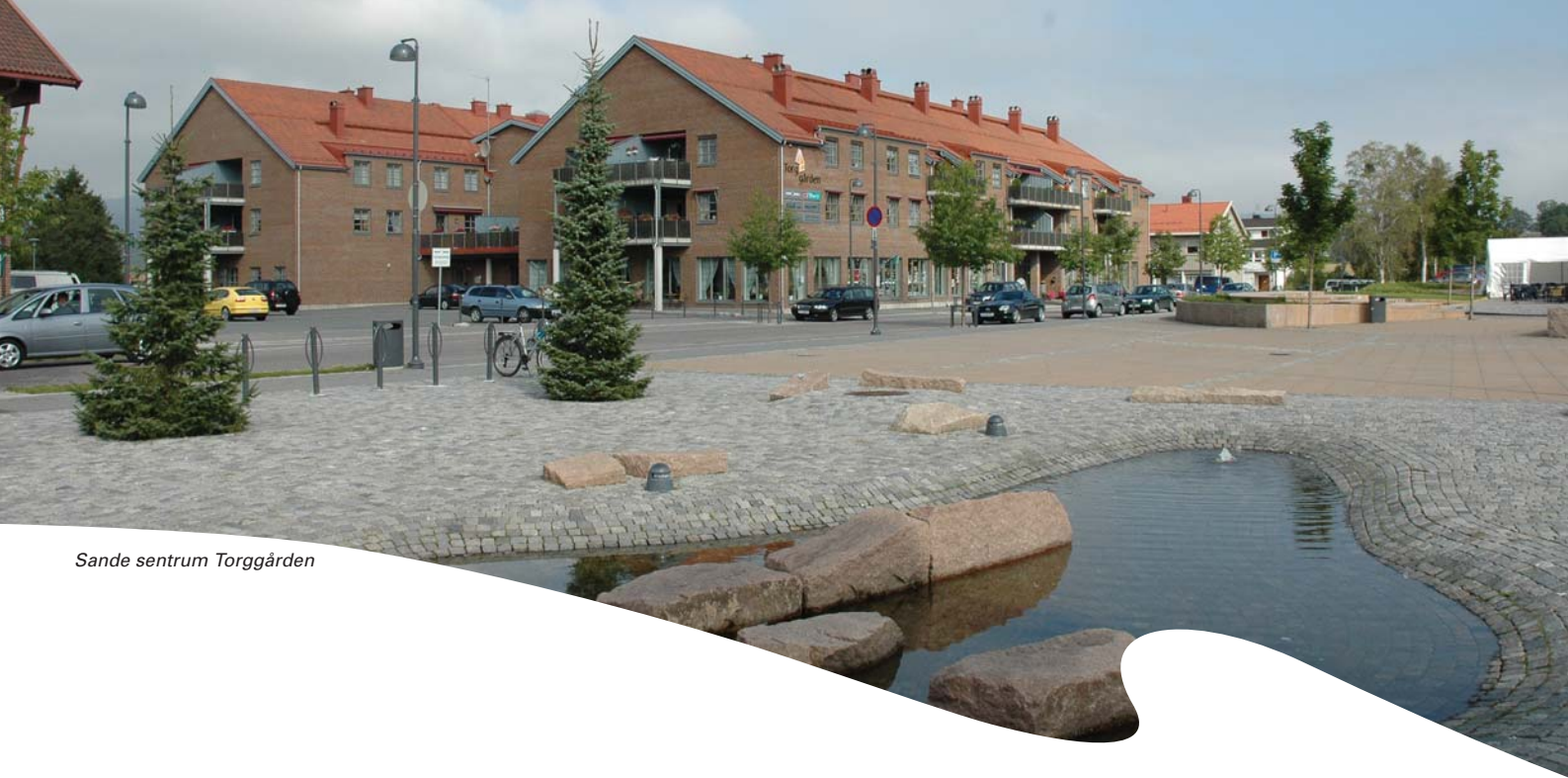
Sande sentrum Torggården