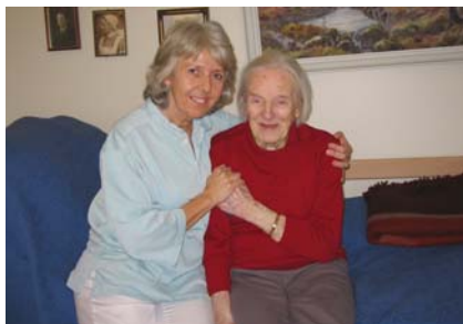
Ansatt og beboer på Sandetun