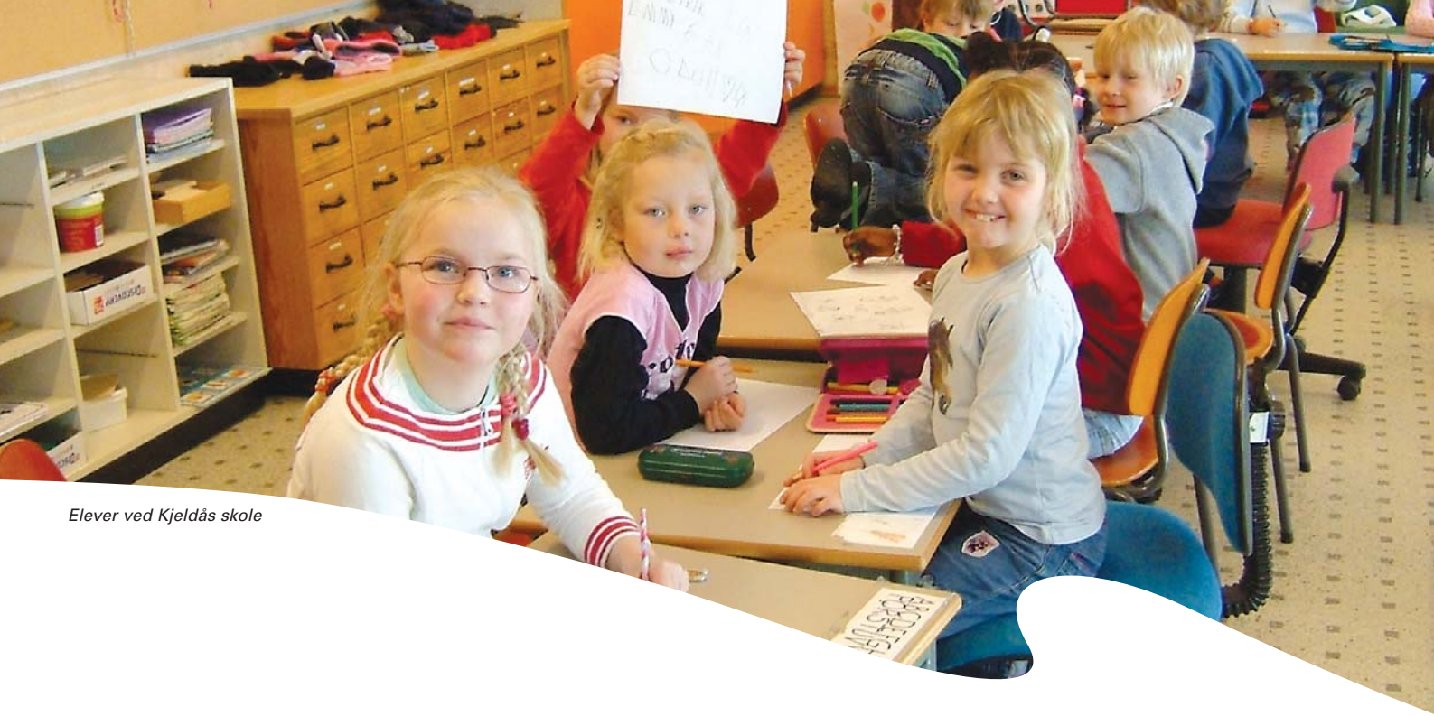
Elever ved Kjeldås skole