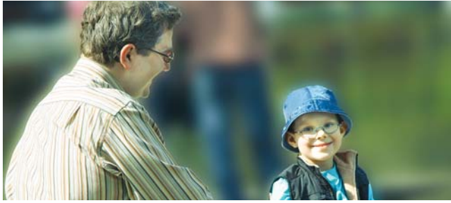
Trivsel i hverdagen