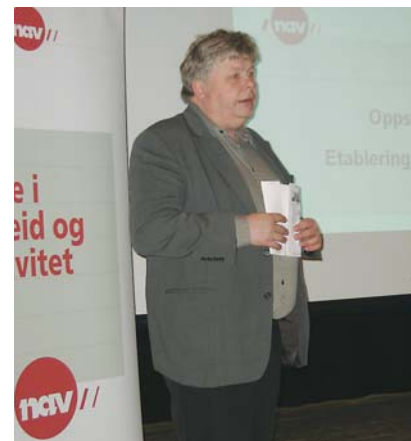
Presentasjon av NAV

Ny arbeids- og velferdsforvaltning (NAV) skal innføres i alle kommuner innen 2009. Dette innebærer at tidligere trygdeetat og Aetat skal slå sammen med ulike kommunale tjenester til et felles kontor. NAV-kontor i Sande er under planlegging og vil bli åpnet i rådhuset i slutten av 2007. Publikum vil dermed kunne henvende seg på ett sted og få den hjelpen de trenger. Dessuten vil det bli lettere å samordne ulike tiltak, gi god veiledning og lette tilbakeføringen til en meningsfylt hverdag.