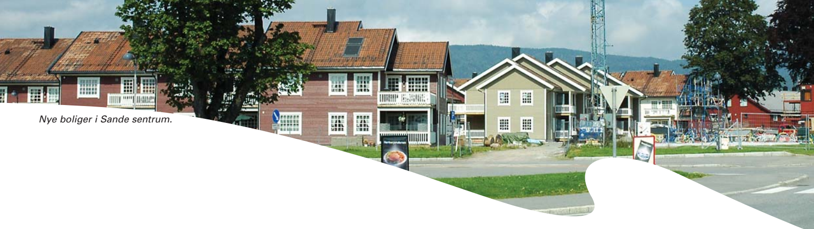
Nye boliger i Sande sentrum.

Mål og strategier for kommuneplanperioden: