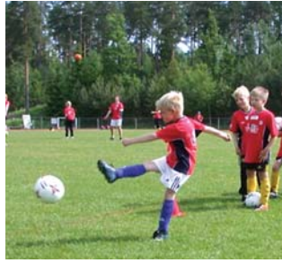
Fotballskole på Selvikbanen