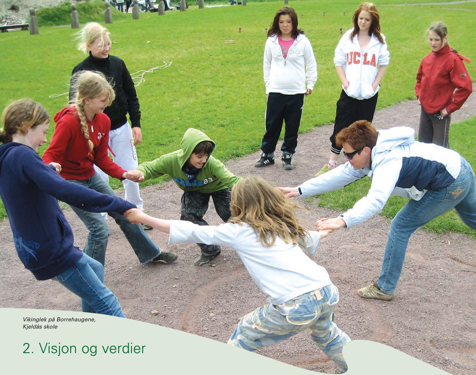
Vikinglek på Borrehaugene, Kjeldås skole