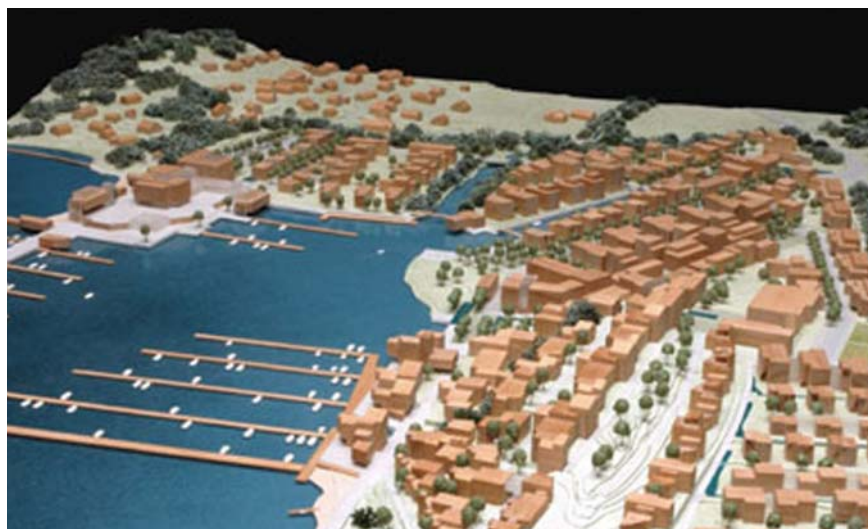
Modell og illustrasjonsfoto av Nordre Jarlsberg Brygge