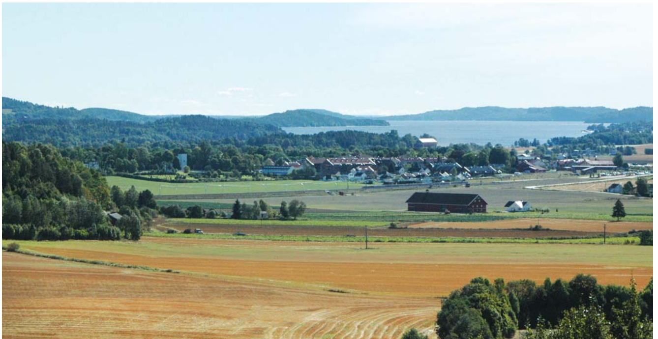
Utsikt mot sentrum og Sandebukta